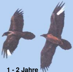
1 - 2 Jahre Markierungen deutlich

Grafiken: El Quebrantahuesos en los Pireneos (R. Heredia y B. Heredia); Ministerio de Agricultura Pesca y Alimentación. Publicaciones del Instituto Nacional para la Conservación de la Naturaleza, 1991