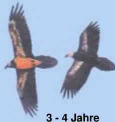
3 - 4 Jahre Kopf noch dunkel