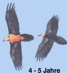
4 - 5 Jahre helle Kopffärbung