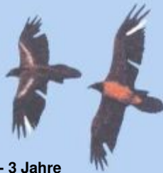
2 - 3 Jahre Markierungsreste u. Lücken