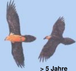
> 5 Jahre Kopf gelblich/rötlich